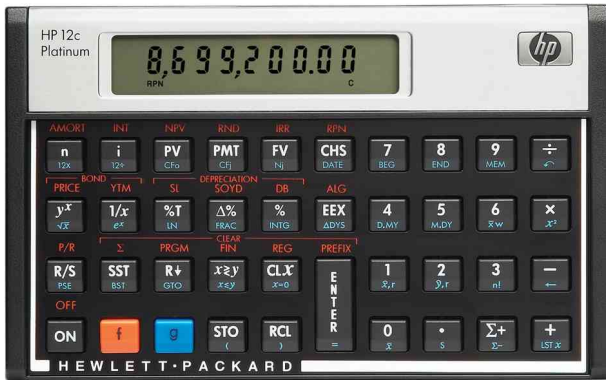
HP 12c Platinum