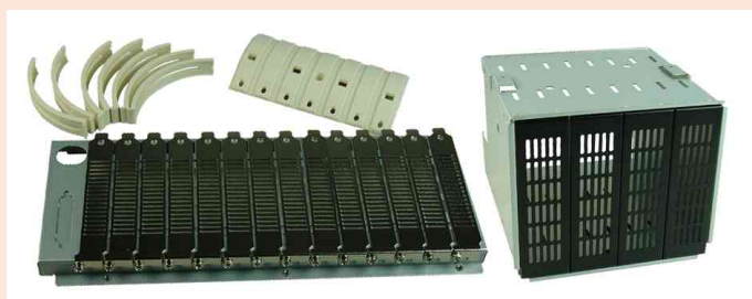
Modularzubehör: Slots und Einbauschacht