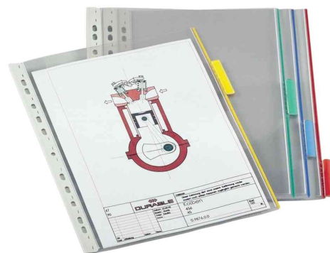
Sichttafeln DIN A4