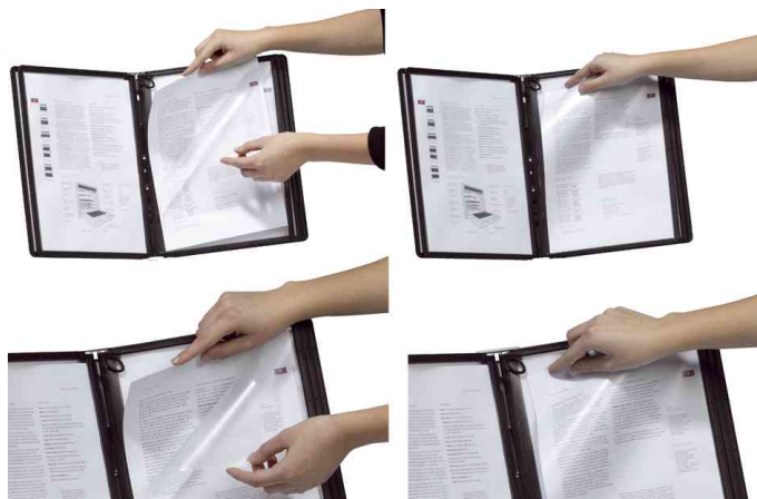
Sichttafel Panel PLUS: schnelles Auswechseln von Informationen