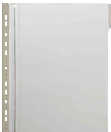
Sichttafeln Panel Safe DIN A4