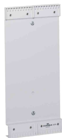
Wandhalter, für 20 Sichttafeln