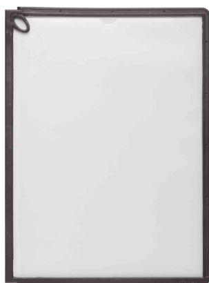
SHERPA® Sichttafeln Panel PLUS