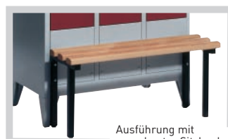
Ausführung mit vorgebauter Sitzbank