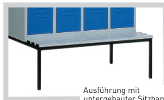
Ausführung mit untergebauter Sitzbank